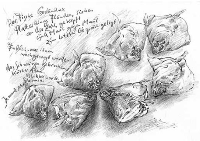
„Der Fische Geständnis“