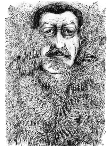
„Im Farn II“

Der Kunstkreis Preetz zeigt vom 19. September bis 17. Oktober 2010 Werke von Günter Grass.